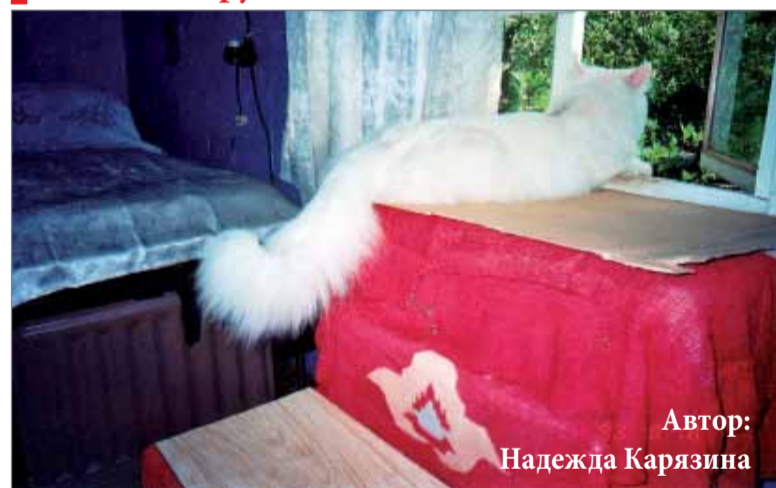
Автор: Надежда Карязина