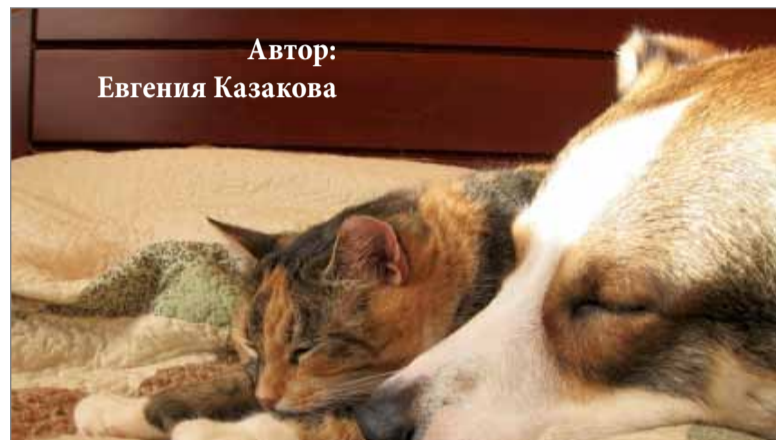
Автор: Евгения Казакова

Итоги конкурса будут подведены в начале января. О них мы сообщим в первом номере 2012 года в Академическом вестнике и группе «ВКонтакте».