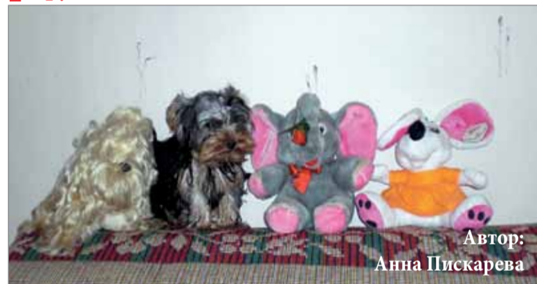
Автор: Анна Пискарева